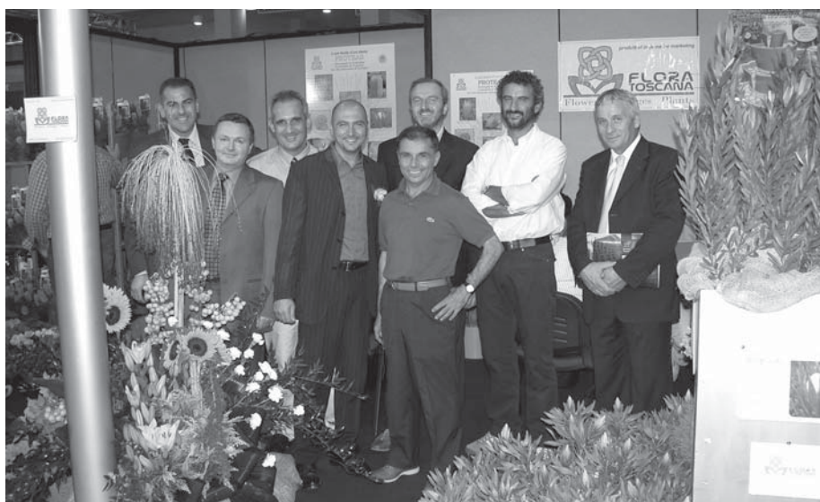
Flora Toscana: tutti insieme appassionatamente.

Se gli operatori florovivaistici si ostineranno a cercare di percepire il futuro dal punto di vista della macchina in curva ... ebbene,